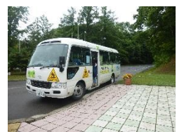
バスさん、うんてんしゅさん、