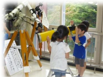
ほしみえるかな・・・？