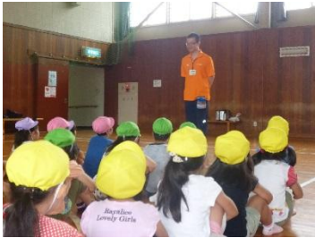
しぜんのいえのかたへごあいさつ