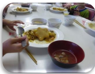
おいしい！ おかわり～