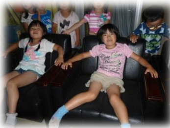
しゃちょうのいすだ！