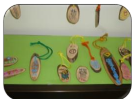
ねんちょうさんのきスリスリだ