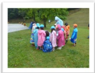
バッタやコオロギがいたよ