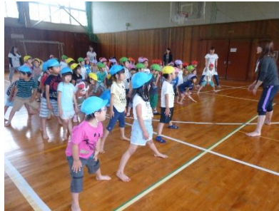
あさのたいそう1・2・3