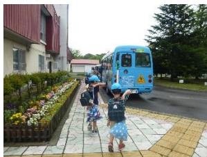
さあ、おうちにかえろう