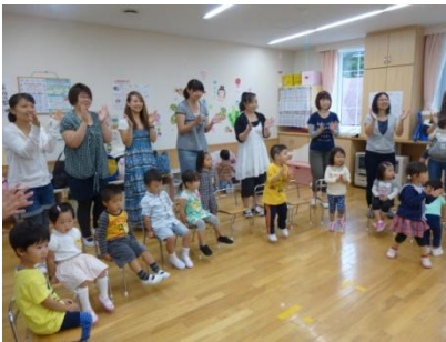
お母さん方にも魚になって もらいました♡