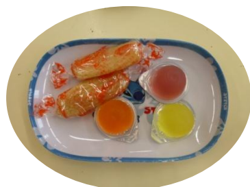
今日のおやつです