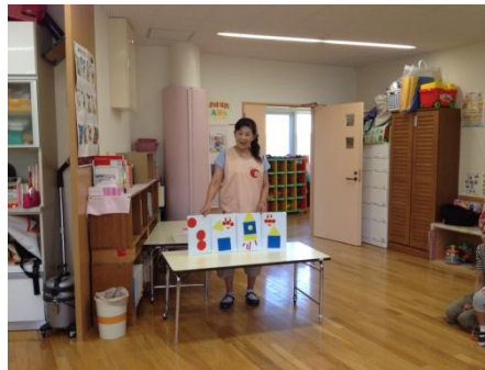
ボードを使って●▲■のお話です。