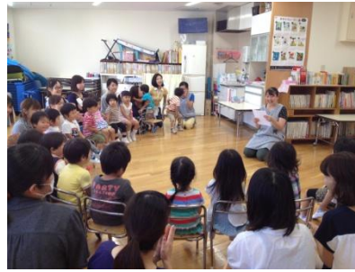
お名前呼びまーす