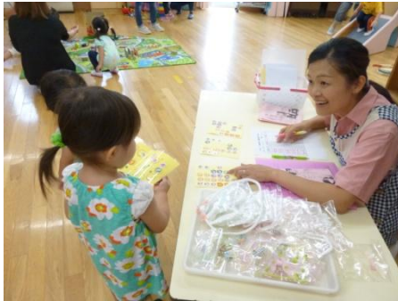
おはようございます